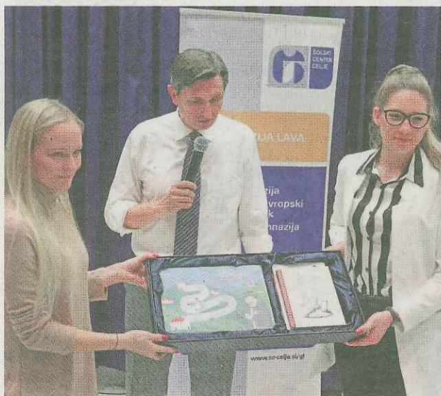
Spominsko darilo predsednika Pahorja dijakinjama in šoli