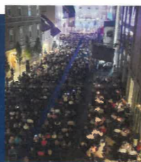
NA NASLOVNICI: VEČERNA GLASBENA ČAROVNIJA 2019